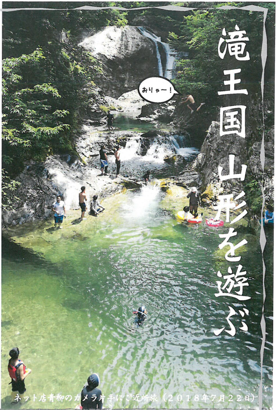
ネット店青柳のカメラ片手にご近所旅 (2018年7月22日)