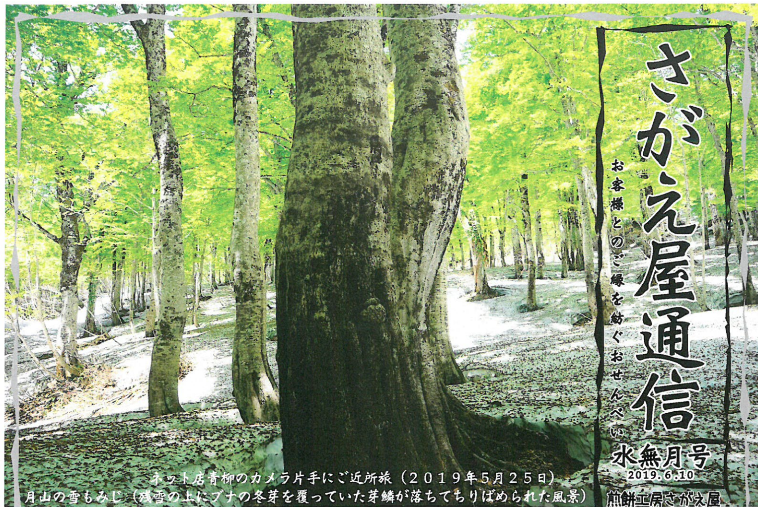
ネット店青柳のカメラ片手にご近所派(2019年5月25日) 月山の雪もみじ(残雪の上にブナの冬芽を覆っていた芽鱗が落ちてちりばめられた風景)

山形県の中央部、出羽三山の一つである月山(標高1984m)は、雪深く万年雪をたたえる自然豊かな山です。山麓にはブナの原生林が広がり、新緑の景色が素晴らしいです。この景色をさがえ屋のお客様に紹介したく、2回ほど行ってきました。(山形県立自然博物館で行っているブナ林散策ツアーに参加)ポラントニアの方の案内で残雪の森に入っていきます。約2時間半の行程。鳥の鳴き声に包まれながら急な山道を進みます。その途中で雄大な景色を眺めたり、このブナ林に住んでいる植物や動物の話の聞いたりとても興味深い話を聞く事ができました。途中、冷たい湧水でのどを潤し、ブナの新緑の緑に癒されました。最終目的地の周海沼。輝く残雪と、水面に映ったブナの緑はとても素晴らしいものでした。この雪どけ水がこの森に染み込み、何百年の時間を経て湧水となり、川に流れ込み、私たちの生活を潤します。その原点を訪ねて改めて自然の豊かさに感謝する気持ちが生えました。 ※5月2日に行った時は熊にも遭遇!ちよっとだけ焦りました。