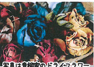
写真は青柳家のドライフラワー

ネット店の青柳の奥さんの誕生日には、いつも花束をプレゼントしています。バラをメインにした花束。一応喜んでくれているのではないのでしょうか？花瓶に入れて自慢のガラケーでパシャパシャ写真を撮る音が聞こえます。バラは後にドライフラワーになり玄関に飾っています。いつの間にかこの場所は奥さんの大切な物を飾る場所になりました。時には新聞紙で作った魚のようなオブジェ等。ちょっとびっくりもしますが、毎日楽しく見ています。