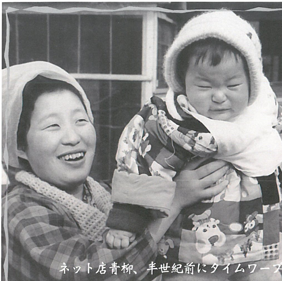
ネット店青柳、半世紀前にタイムワープ